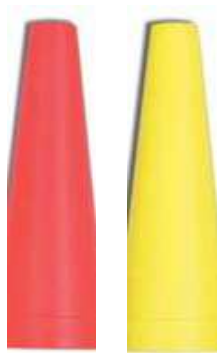
Art.-Nr.: MS81 MS82 rot gelb Mag-Lite Warnaufsatz für C/D-Cell