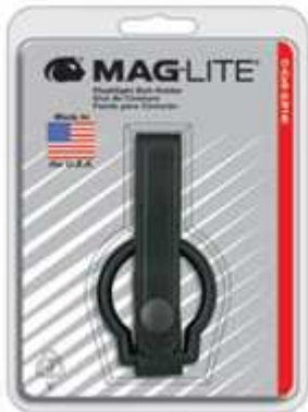
Art.-Nr.: PSD84 D-Cell Mag-Lite Gürtelhalter Leder, Ringhalterung