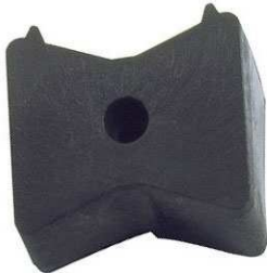
Art.-Nr.: 85004 Verbindungsstück für Defender III Lieferung erfolgt paarweise