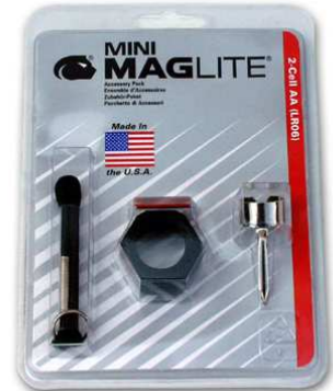
Art.-Nr.: NH1 Mag-Lite Zubehörset Mini-Mag (3 Streuscheiben, Clip u. Hand- schlaufe)