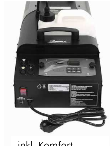
inkl. Komfort- Kabelfernsteuerung