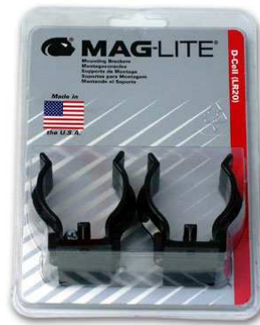
Art.-Nr.: MLAH Mag-Lite Autowandhalterung, Kunststoff, 2-teilig