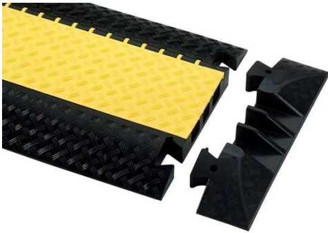
Art.-Nr.: 85008 Adam Hall Endstück für Kabelbrücken