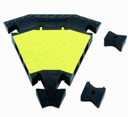
Art.-Nr.: 85009 Defender 45° Biegung inkl. Verbinder Gewicht: 5,36 Kg